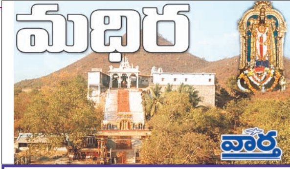
మధిర, బోనకల్, చింతకాని, ఎర్రపాలెం, ముదిగొండ