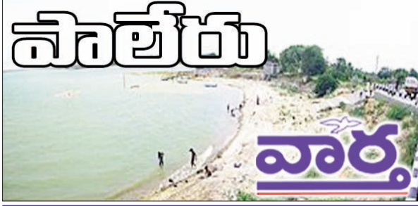
నేలకొండపల్లి, ఖమ్మం రూరల్, కూసుమంచి, తిరుమలాయపాలెం