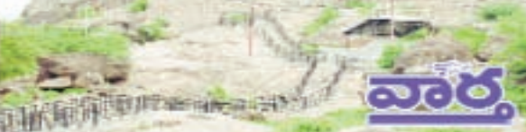
ఖమ్మం, కార్పొరేషన్, రఘునాథపాలెం, కల్చరల్, ఖమ్మం రూరల్