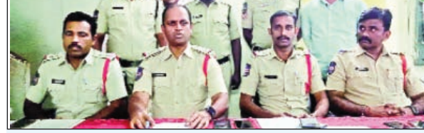
కూసుమంచి, డిసెంబర్ 23 (ప్రభాతవార్త):